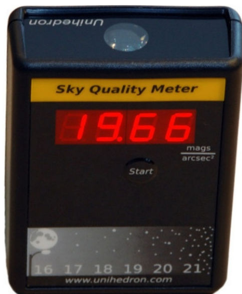
2. ábra. A fényszennyezésmérő készülék [8].

A Rayleigh-szórás esetén a fényszóródás nagymértékben függ hullámhossztól (a hullámhossz negyedik hatványával fordítottan arányos). Ez az oka például az égbolt kék színének is. A Napból érkező sugarak közül ugyanis a kék komponens, rövidebb hullámhossza miatt sokkal erősebben szóródik, mint a vörös. A lenyugvó, illetve felkelő Nap esetében tapasztalható vöröses árnyalat úgy jön létre, hogy a kék fénynek az eredeti iránytól való nagyobb mértékű kiszóródása miatt a vörös komponensek maradnak meg.