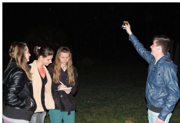
3. ábra. A szakkör tagjai mérés közben.

Méréseinket Szekszárd város egymástól viszonylag távol eső pontjain végeztük, mértük az éjszakai ég háttérfényességét, majd a szőlődombok közötti gyalogos éjszakai túrák alkalmával Szekszárd közvetlen környezetét is feltérképeztük.